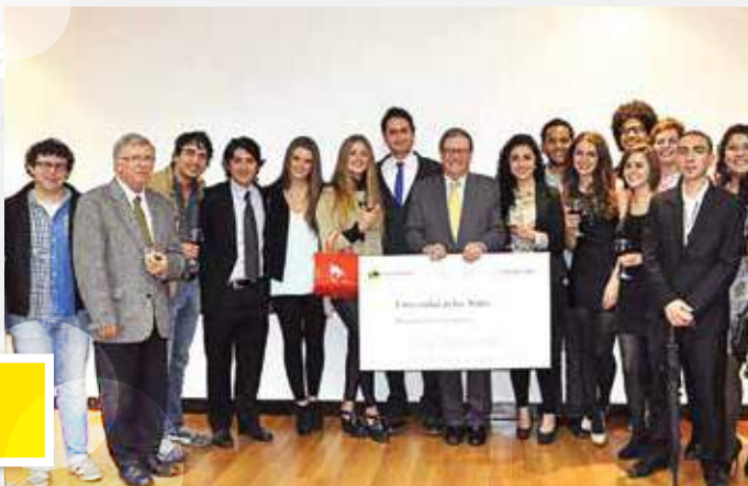
Asociación de egresados de la Universidad de los Andes